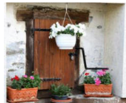
4. Nochersch Born