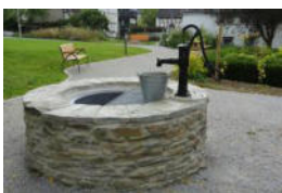
6. Pfarrgarten Brunnen