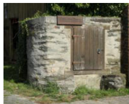
3. Köhlers Born